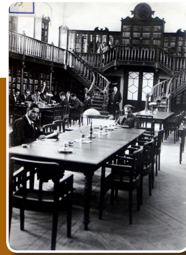
Biblioteca do Instituto Arquivo do Instituto Superior de Agronomia

São publicadas várias edições dos apontamentos e aditamentos das cadeiras que leciona.