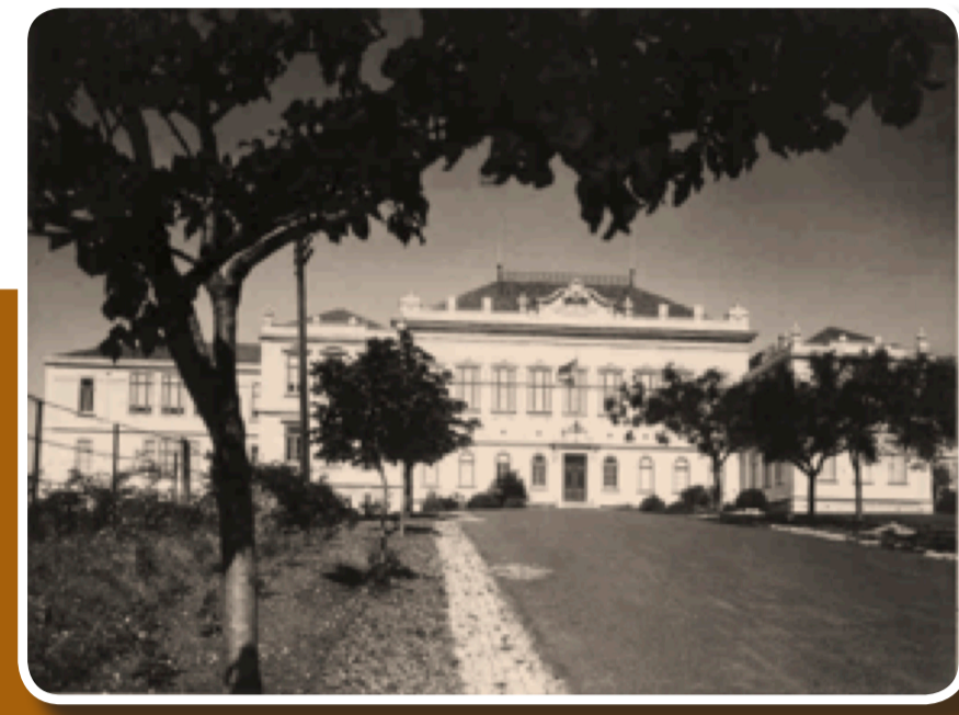
Instituto Superior de Agronomia

Em 1951 é nomeado, após concurso em provas públicas, Professor Catedrático do 3.º grupo (Matemática Gerais e Cálculo Infinitesimal e das Probabilidades) do Instituto Superior de Agronomia.